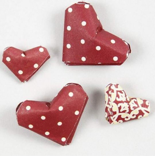
Die kleinen Herzen sind aus Papierstreifen gebastelt.